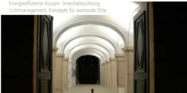
Energieeffiziente Aussen- Innenbeleuchtung. Lichtmanagement, Konzepte für wartende Orte.

Die Aufgaben des EnergieManagements beinhalten neben den üblichen Analysen der Gebäudehülle und Anlagentechnik auch die Bewertung der Belichtung & Beleuchtung (Tageslichttechnik / Lichtmanagement). Auch der Einsatz modernster Technik und Berechnungs- und Simulationssoftware sind Bestandteile des Leistungsangebotes. Das Spektrum reicht bis hin zu Überprüfungen konservatorischer Maßnahmen (Strahlung & Schädigungspotenzial, Objekttempfindlichkeit und -schädigung sowie Raumklima und Behaglichkeit). Der Stromverbrauch u.a. für die Beleuchtungsanlage nimmt einen großen Teil der Gesamtkosten für das Gebäude in Anspruch. Auch hier sind innovative und energieeffiziente Konzepte bis hin zu Stromeigenproduktion gefragt.