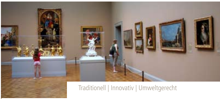
Traditionell | Innovativ | Umweltgerecht